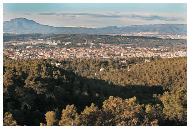
Sant Cugat avec la montagne de La Mola au fond