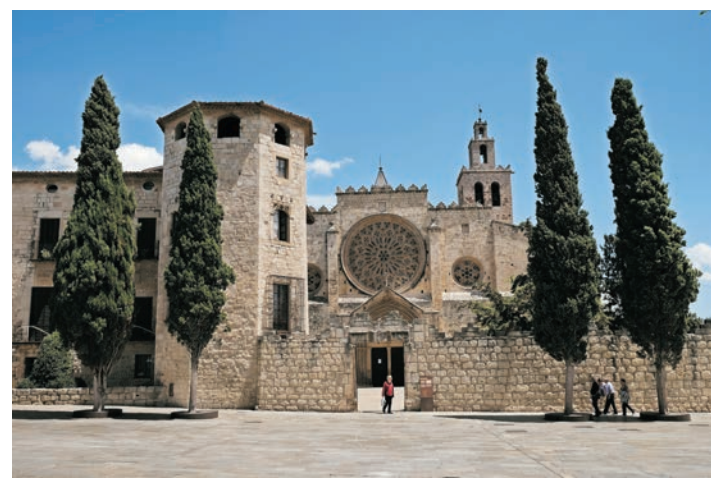
Monastère de Sant Cugat

Petite chapelle construite entre les XVIIe et XVIIIe siècles au croisement des anciennes routes de Terrassa, Rubí et Sant Andreu de la Barca. Plus tard, il fut retiré du chemin et un porche, démoli à la fin du XIXe siècle, y fut ajouté. Abandonné pendant des années, il a été restauré en 2007.