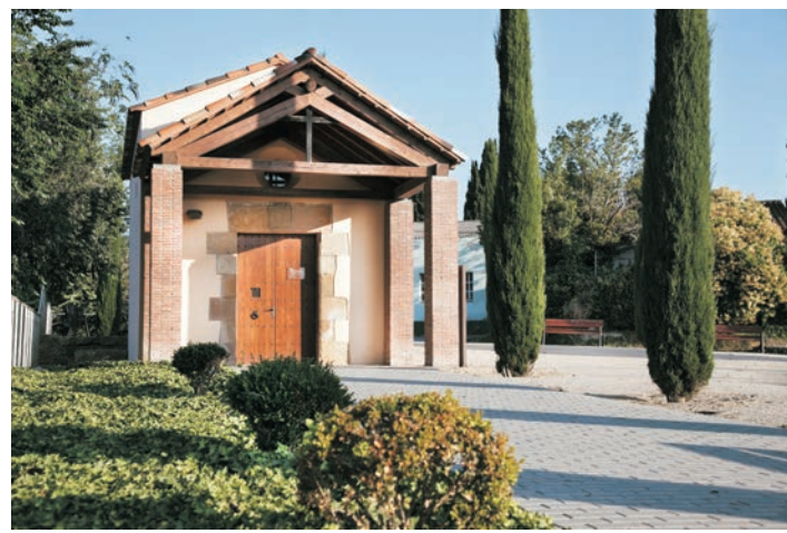
Ermitage de Sant Domènec