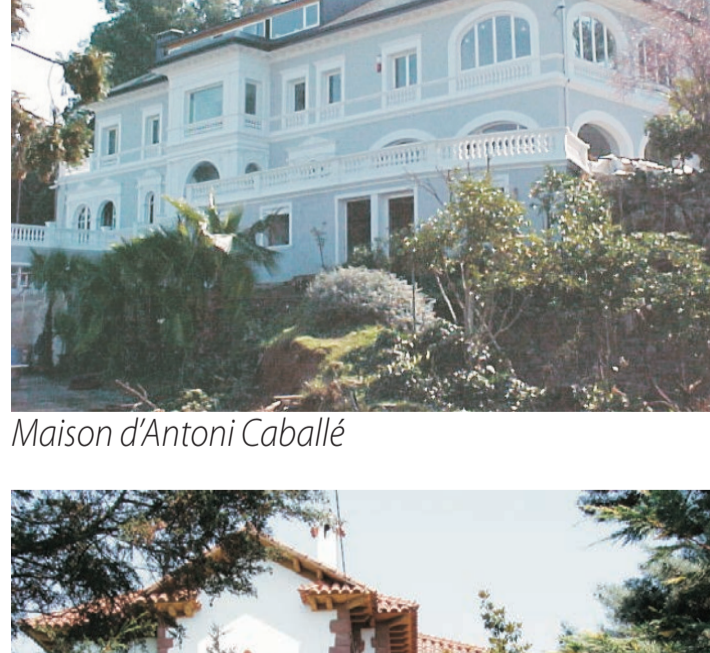
Maison d'Antoni Caballé

Josep Graner i Prat, maître d'œuvre et architecte moderniste, auteur de la maison Fajol ou de la maison du Papillon du n° 20 de la rue Llança à Barcelone et des maisons de Leandre Vidal dans la rue Fraternitat du quartier de Gràcia à Barcelone. Il était maître d'œuvre municipal pour la mairie de Montcada i Reixac. Il a exécuté plusieurs bâtiments répertoriés dans le catalogue de Sant Cugat del Vallès.