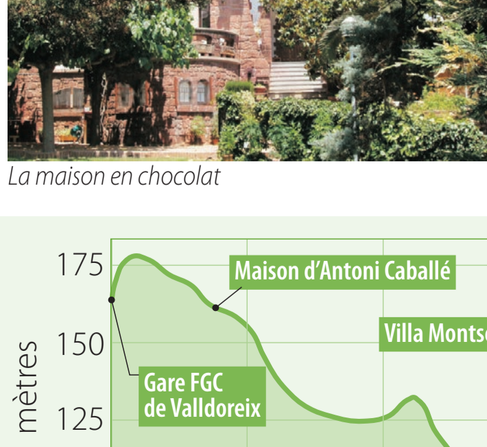
La maison en chocolat