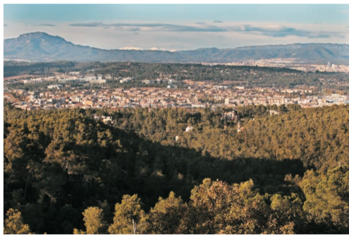
Sant Cugat y la Mola al fondo