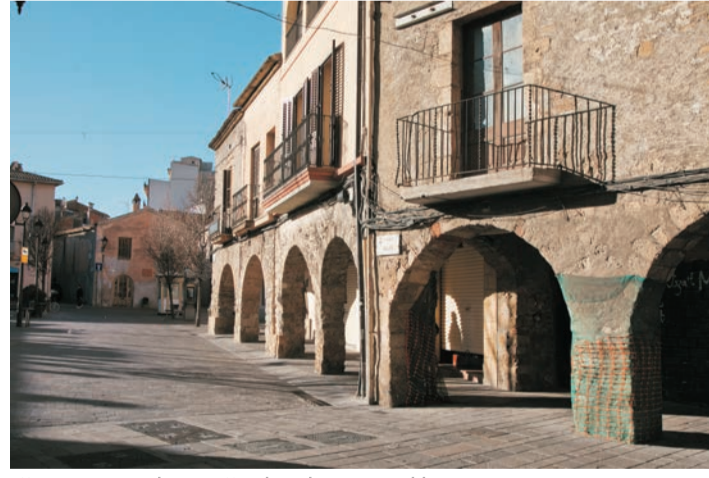
"Les Voltes" de la Calle Major