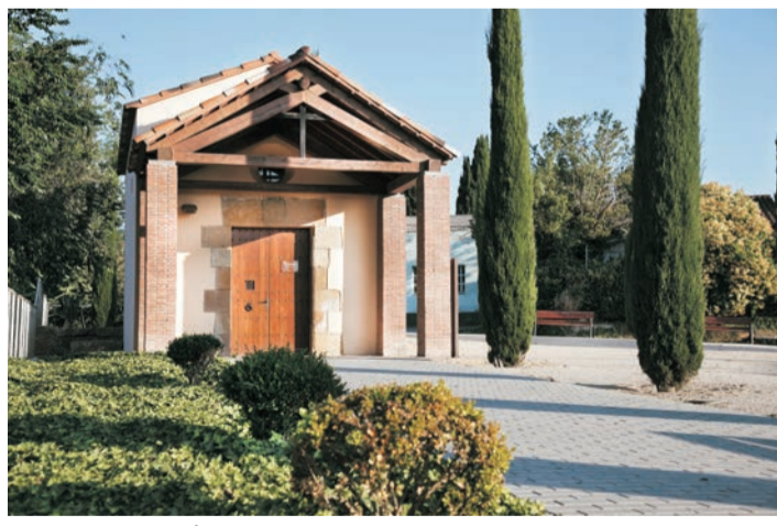
Ermita de Sant Domènec