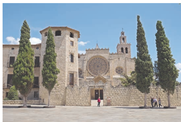
Monastère de Sant Cugat