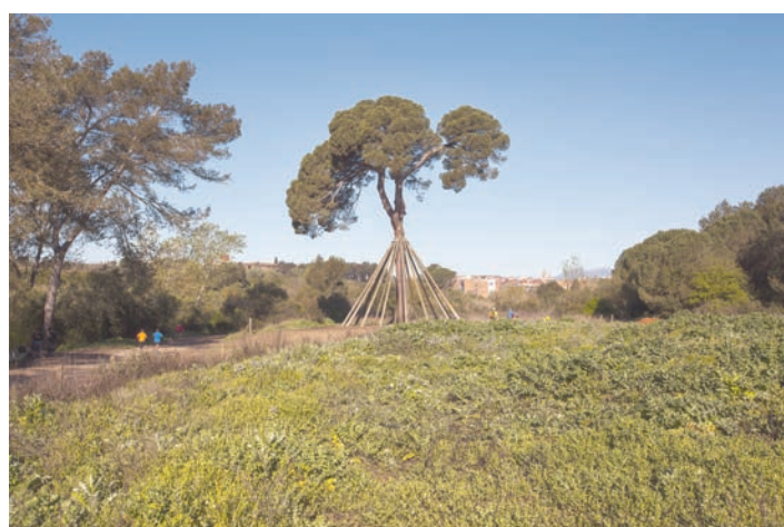
Pi d'en Xandri