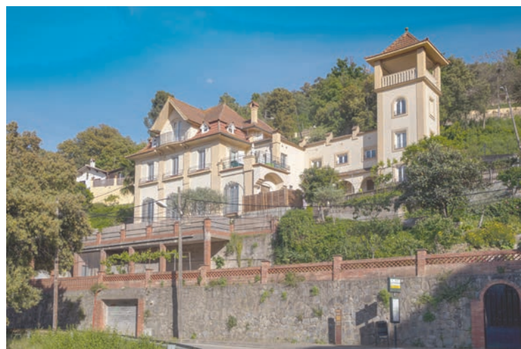
Sanatorium de Fumet

Ouvrage s'inspirant de l'architecture d'Europe centrale réalisé en 1926 par le maître d'œuvre Josep Graner i Prat sur la commande d'un médecin d'origine allemande qui souhaitait faire construire un sanatorium pour les patients tuberculeux. Le jardin présente une succession intéressante de terrasses et de dénivellements plantés de chênes verts et de pins. Cette villa n'a jamais rempli sa fonction de sanatorium à cause de la Guerre Civile espagnole.