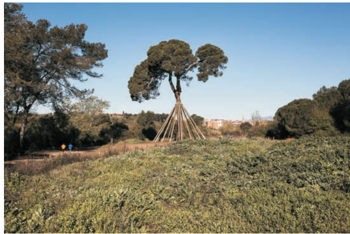
Pi d'en Xandri

Iglesia de origen románico pero muy transformada, con un relieve gótico de 1447. De planta rectangular, con bóveda de cañón y campanario en espadaña. Lugar muy popular, el 3 de marzo se celebra la tradicional romería hasta Sant Medir, en honor al patrón de la ciudad.