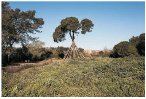
Pi d'en Xandri

La structure actuelle de cette ferme, située dans la vallée de Gausac au milieu du chemin traditionnel de Sant Cugat à Sant Medir, correspond au XVIIIe siècle. À proximité se trouve l'étang de Can Borrell dont l'eau était conduite à la citerne de la ferme à des fins agricoles.