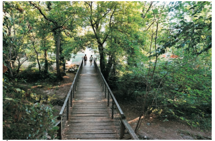
Étang de Can Borrell