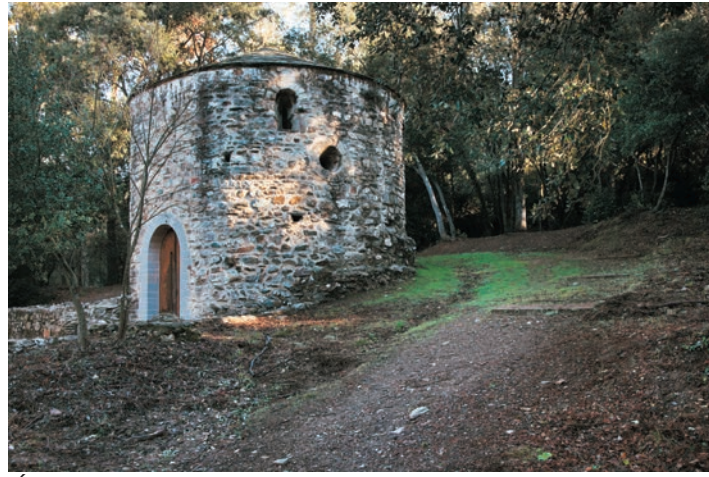
Église de San Adjutori