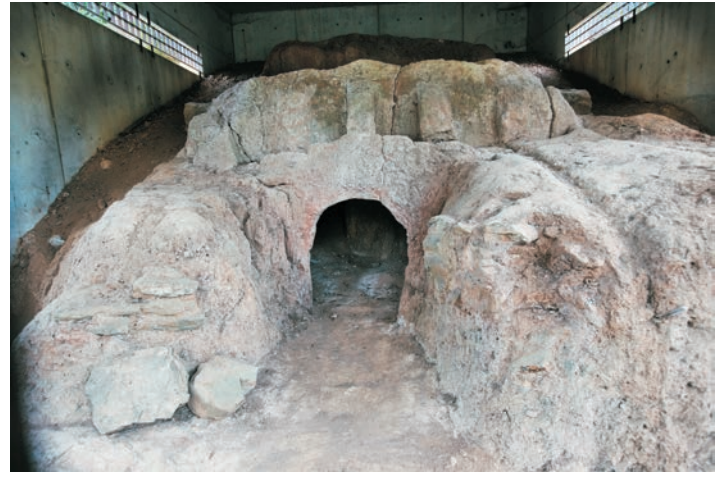
Four de Sant Adjutori