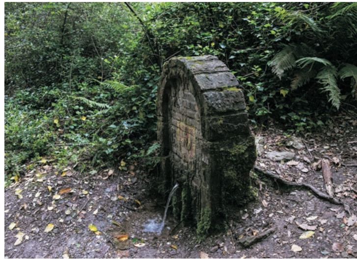
Fontaine de Sant Vicenç del Bosc