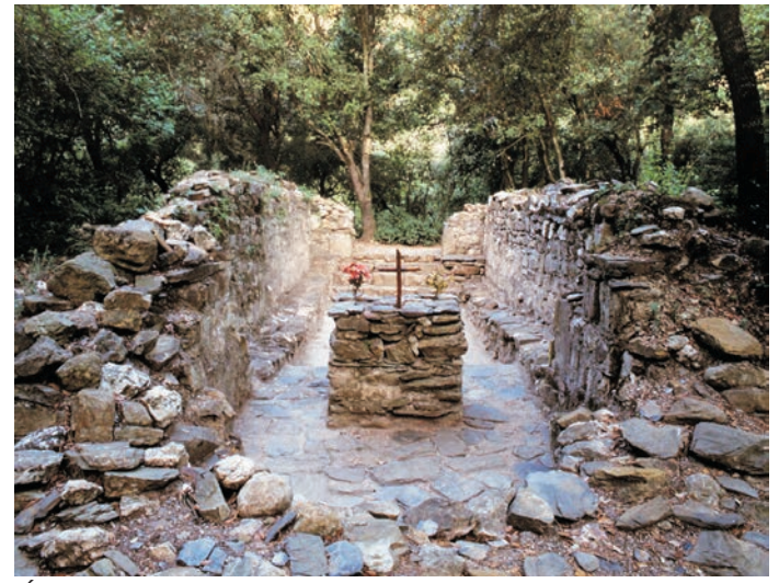
Église de Sant Vicenç del Bosc