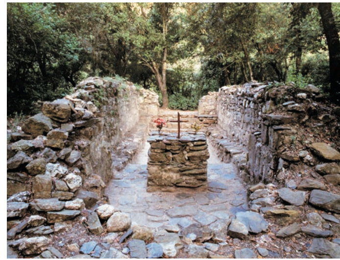
Església de Sant Vicenç del Bosc