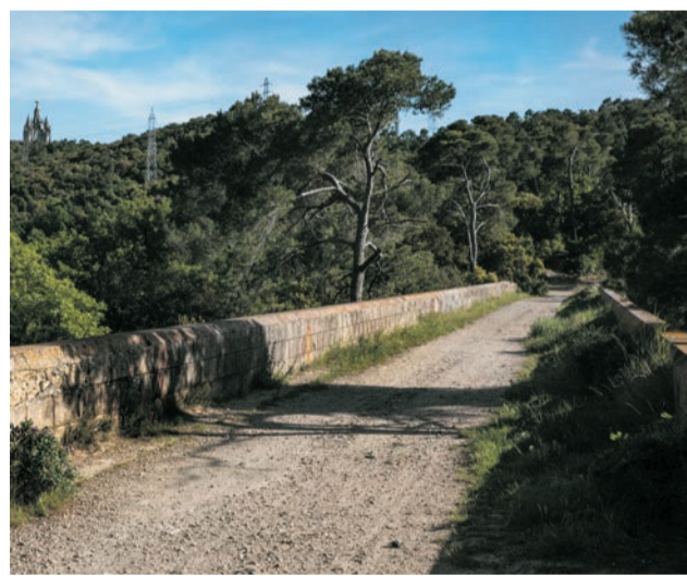
Viaduc de Can Ribes

Ensemble de trois fontaines sur une grande esplanade. La construction est en pierre crépie de ciment qui occupe toute la hauteur de la margelle et acquiert des formes volumineuses et irrégulières rappelant La Pedrera.