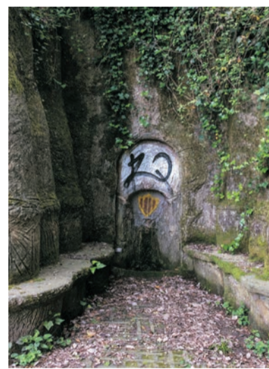
Fontaine de la Rabassada