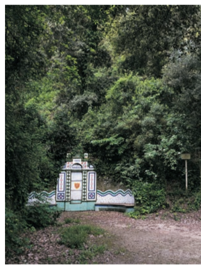
Fontaine d'en Ribes