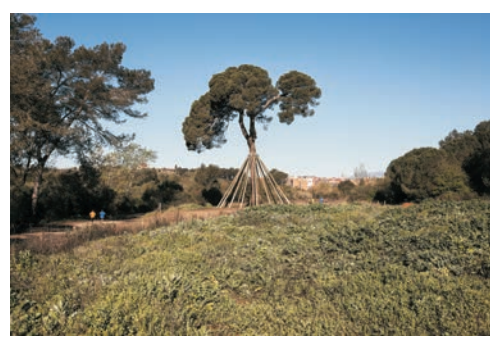
Pi d'en Xandri

Se encuentra en el valle de Gausac y en medio del camino tradicional de Sant Cugat a Sant Medir. La estructura actual de la masía corresponde a la masía del siglo XVIII. Muy cerca, se encuentra el pantano de Can Borrell, que recogía agua para ser conducida al aljibe de la masía para sus usos agrícolas.