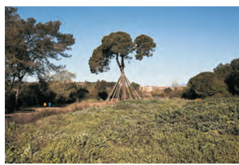
Pi d'en Xandri

La structure actuelle de cette ferme, située dans la vallée de Gausac au milieu du chemin traditionnel de Sant Cugat à Sant Medir, correspond au XVIIIe siècle. À proximité se trouve l'étang de Can Borrell dont l'eau était conduite à la citerne de la ferme à des fins agricoles.