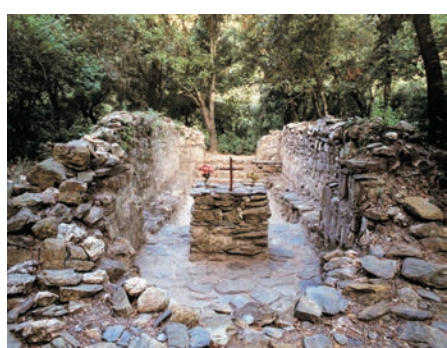
Église de Sant Vicenç del Bosc