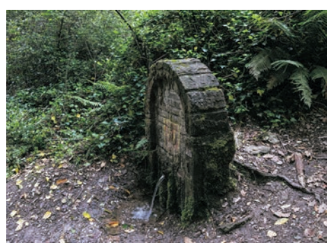
Fontaine de Sant Vicenç del Bosc

La structure actuelle de cette ferme, située dans la vallée de Gausac au milieu du chemin traditionnel de Sant Cugat à Sant Medir, correspond au XVIIIe siècle. À proximité se trouve l'étang de Can Borrell dont l'eau était conduite à la citerne de la ferme à des fins agricoles.